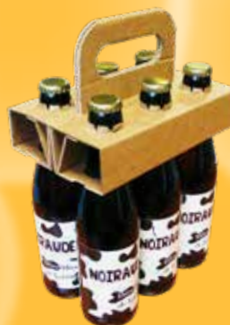
(LH, LB, V)