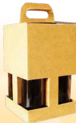
(LH, LB, V)