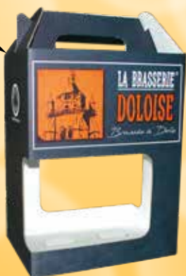
(LH, LB, V)

Exemple d'impression (chiffrage sur consultation)