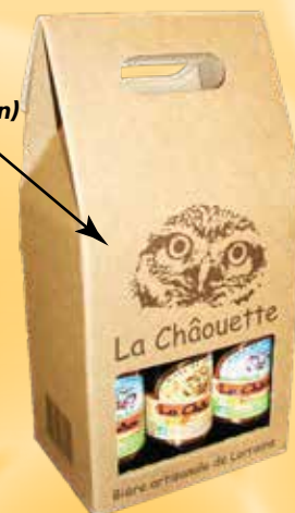
(LH, LB, V)

Exemple d'impression (chiffrage sur consultation)