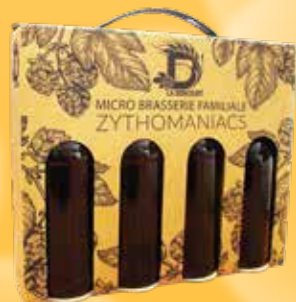
(LH, LB, V)

Exemple d'impression (chiffrage sur consultation)