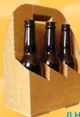
(LH, LB, V)