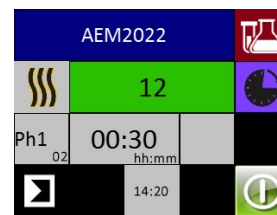
Écran fonction distillerie