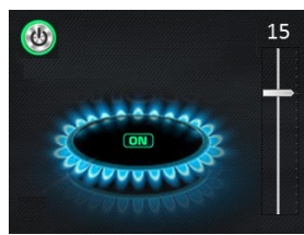
Écran doseur d'énergie